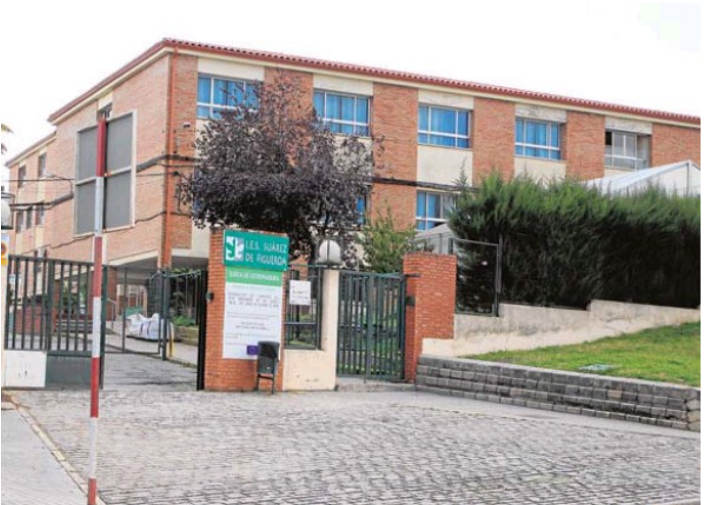
Exterior del Suárez de Figueroa.

La clase de Latín de primero de Bachillerato del Instituto Suárez de Figueroa se reúne para dar clases. Están presentes 14 alumnos de 15, diez de ellos afirman haber querido cursar griego este año, lamentan que la asignatura no apareciera en la matrícula y que esta circunstancia ha condicionado su itinerario formativo.